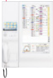
●メインディスプレイ アドバンス表示