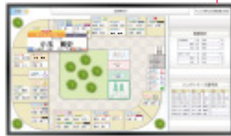
●サブディスプレイ病棟レイアウト表示