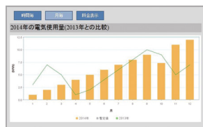
●今年の電気使用量グラフ(昨年との比較)