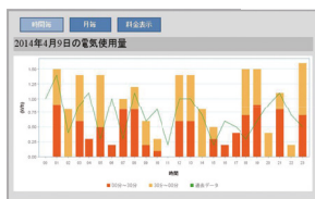
●本日の電気使用量グラフ