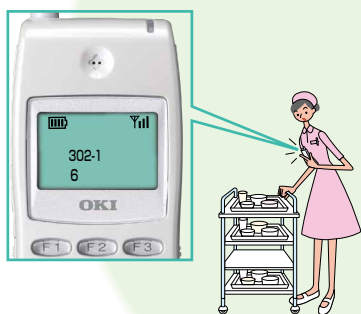
スタッフステーション

患者さんからの呼出が移動中 でも受けられます。また、ハンディ ナーズ間通話や一斉放送なども できます。