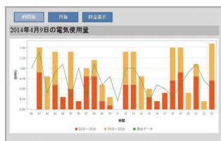
本日の電気使用量グラフ