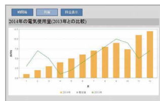
本年の電気使用量グラフ (昨年との過去比較)